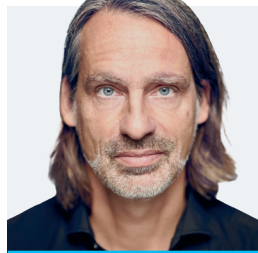
Richard David Precht

Philosoph, Publizist und Bestsellerautor