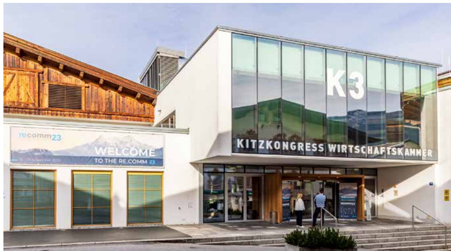
Der K3 Kitzkongress im Herzen der Alpenmetropole bietet das perfekte Setting