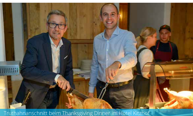
Truthahnanschnitt beim Thanksgiving Dinner im Hotel Kitzhof