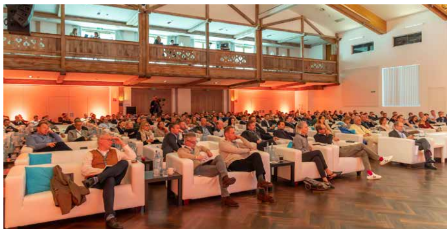
Der große Saal bietet eintspannte Atmosphäre für die zahlreichen inspirierenden Vorträge