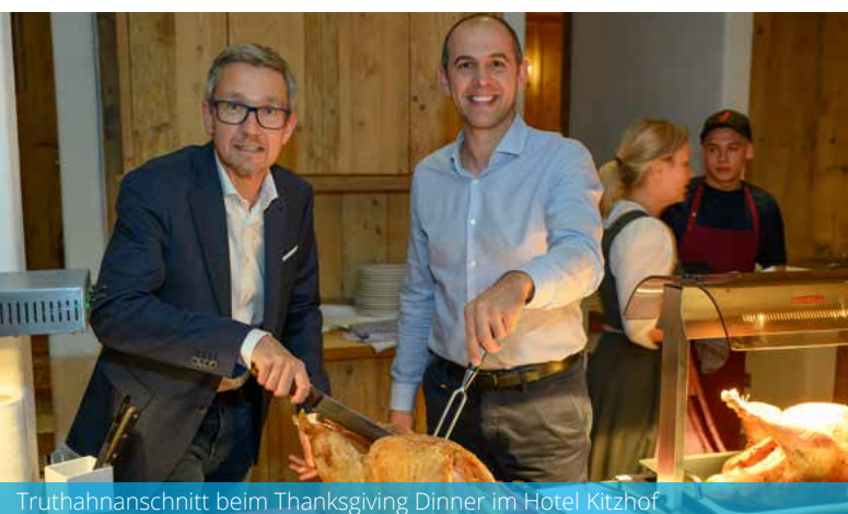
Truthahnanschnitt beim Thanksgiving Dinner im Hotel Kitzhof