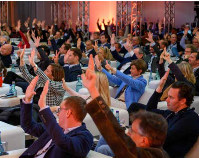
250 Top-Player der Immobilienbranche erwarten neue Inspirationen