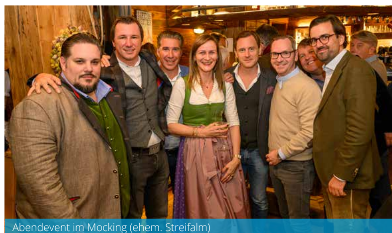
Abendevent im Mocking (ehem. Streifalm)