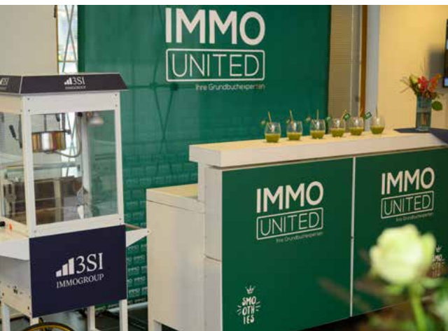
3SI Popcornwagen und Smoothie-Bar von IMMOUnited