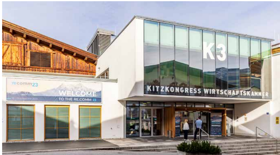
Der K3 Kitzkongress im Herzen der Alpenmetropole bietet das perfekte Setting