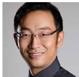
Li Jiang Leiter des Stanford AI/RE-Programms, Experte für KI, Robotik und Bildung