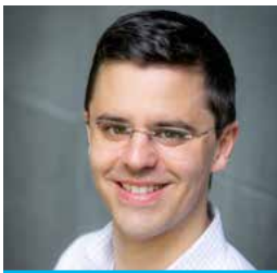
Gernot Wagner Experte für Umweltwissen- schaften, öffentliche Politik, Wirtschaft und Regierung