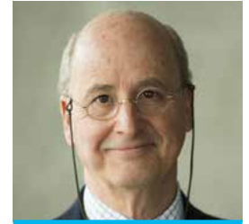
Stéphane Garelli Weltweit anerkannte Autorität für Wettbewerbsfähigkeit